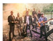
Lars Lillholt Band