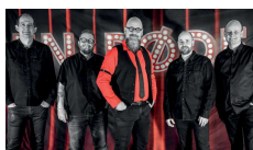
Den Røde Tråd