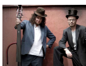
Hawkeye and Hoe