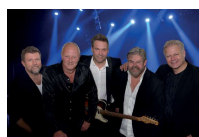
Stig og vennerne